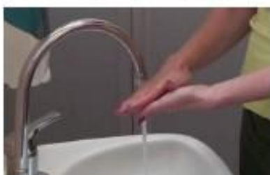
3. Strofinare le mani palmo contro palmo