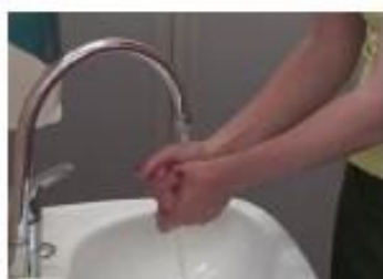
9. Sciacquare molto bene le mani sotto l'acqua corrente