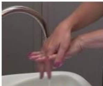
4. Strofinare il palmo destro sul dorso sinistro con incrocio delle dita e viceversa