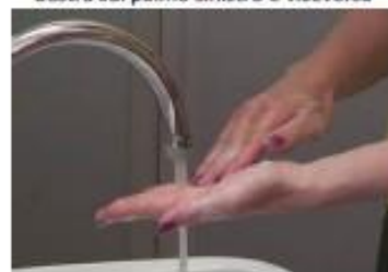
8. Strofinare tramite movimento rotatorio in avanti e indietro con le dita della mano destra sul palmo sinistro e viceversa