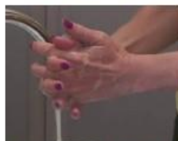
5. Strofinare i palmi con le dita intrecciate