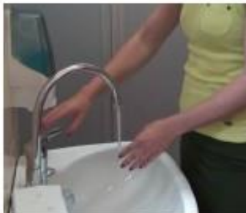
1. Aprire il rubinetto e bagnare le mani con l'acqua