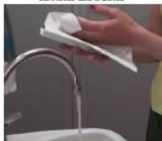
10. Asciugare le mani con una salvietta usa e getta